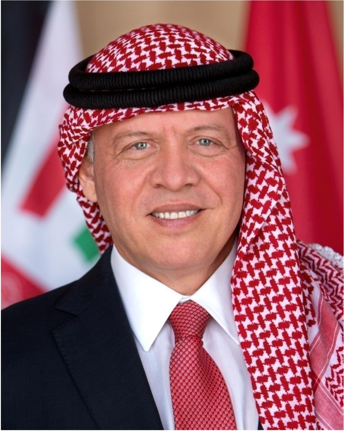
حضرة صاحب الجلالة الملك عبد الله الثاني بن الحسين المعظم