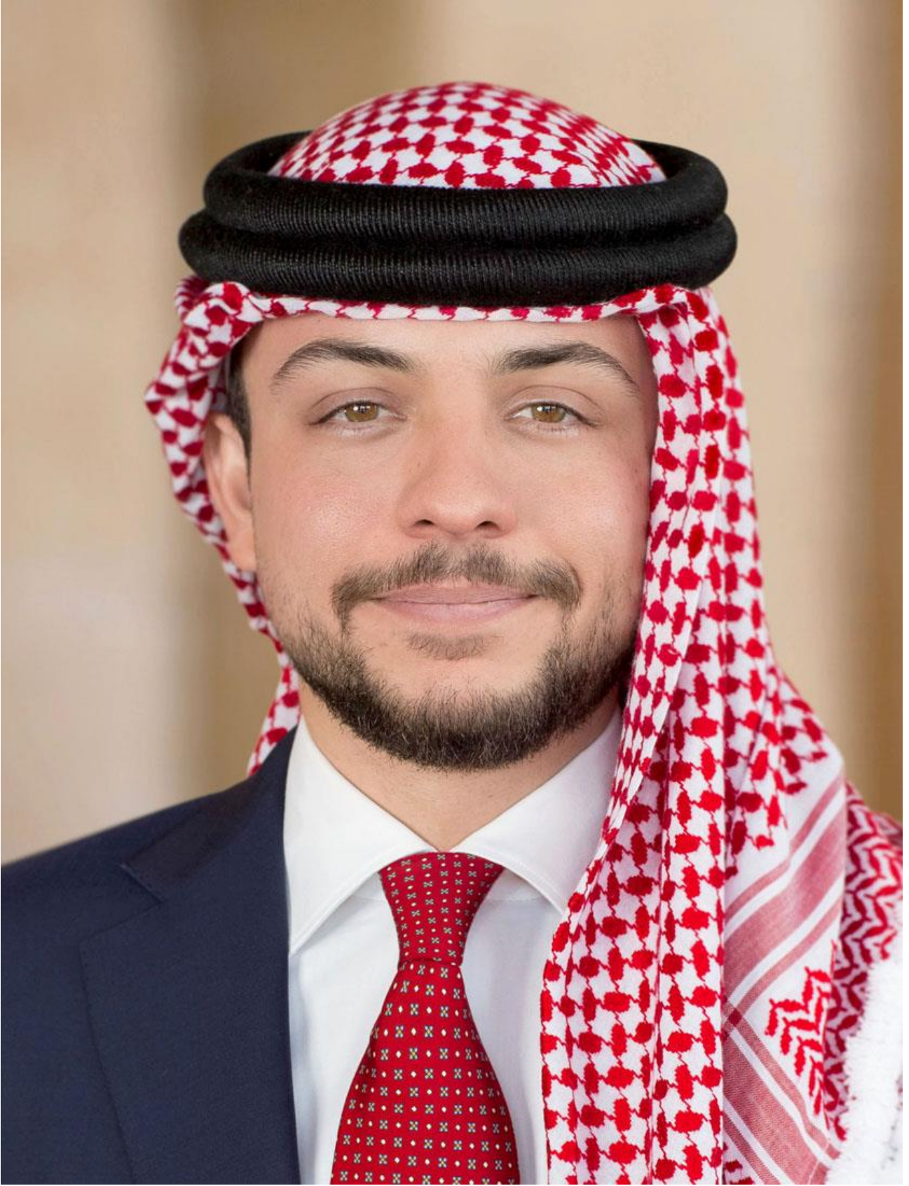
حضرة صاحب السمو الأمير ولي العهد الحسين بن عبد الله الثاني المعظم