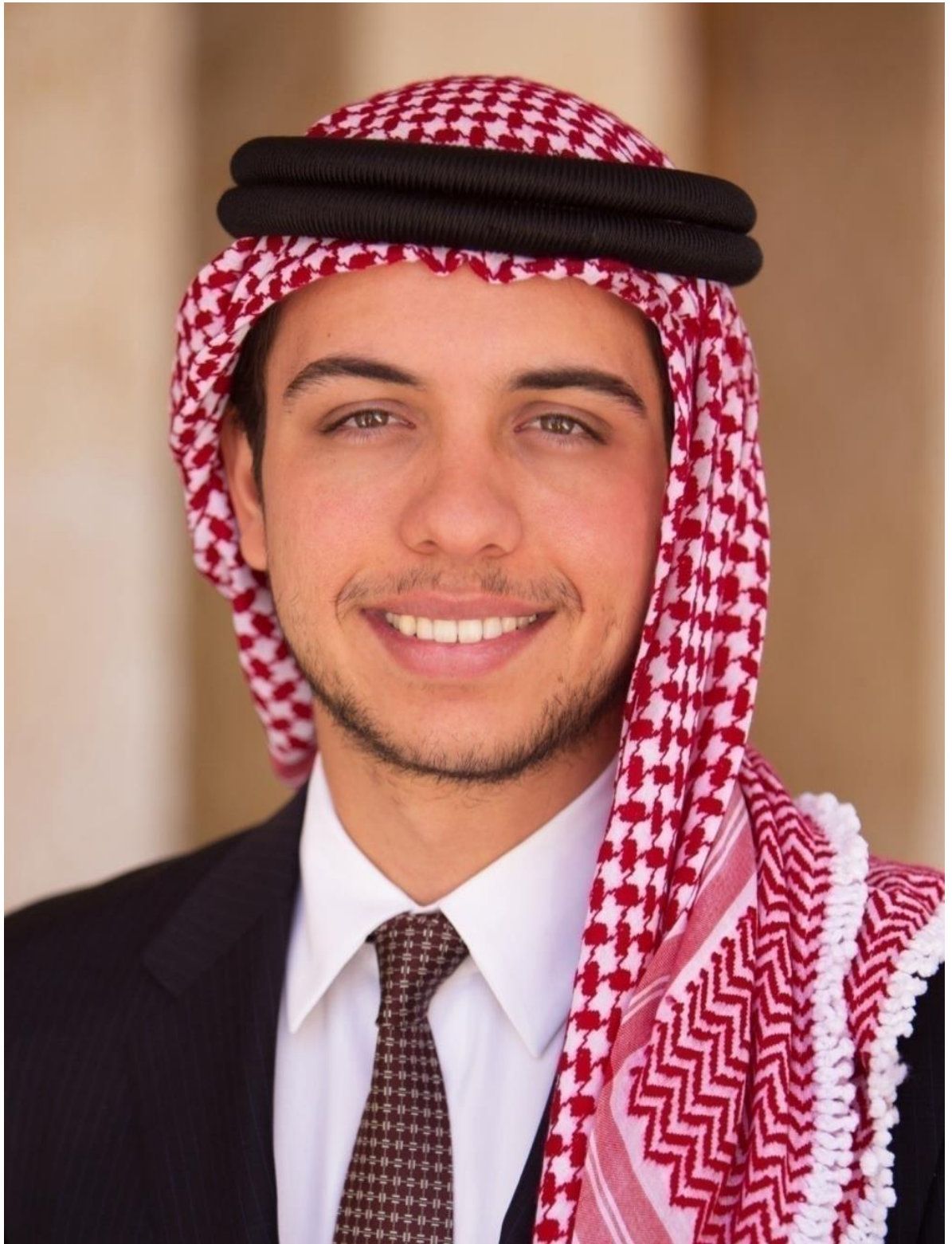
صاحب السمو الملكي الأمير الحسين بن عبد الله الثاني وري العهد المعظم